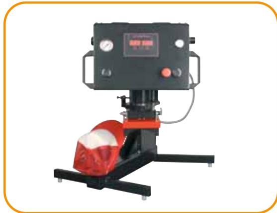
Abb. 4 · Kappenset