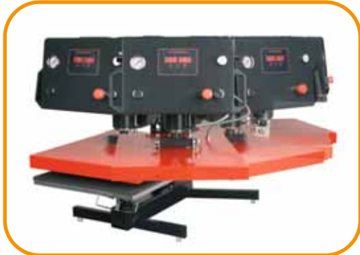
Abb. 5 Großer Schwenkbereich zur einfachen Textil- und Transfer- positionierung