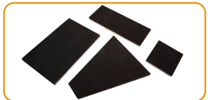
Abb. 3 · Girlie-Platte, längliche Platte, Schirm-Platte, Brusttaschen-Platte

Das Gerät ist auch mit zwei Arbeitsplatten als LTS 750 erhältlich. Die LTS 750 PA bietet zudem einen automatischen Seitenschwenk.