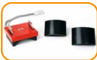
Abb. 1 · Kappenset

Durch die Schwenkbarkeit (s. Abb. 5) wird das Arbeiten in zweifacher Hinsicht erleichtert. Die Heizplatte lässt sich so weit zur Seite schwenken, dass die Druckplatte nicht mehr von ihr verdeckt wird. Das Aufziehen des Textils ist noch bequemer, außerdem haben Sie einen Blick auf das gesamte Textil. Die Positionierung des Transfers ist somit wesentlich einfacher.