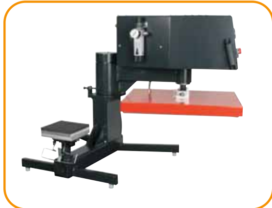
Abb. 7 · Brusttaschen-Druckplatte