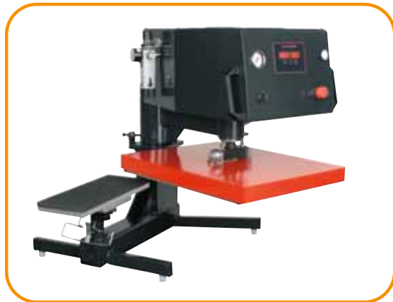
Abb. 6 · Ärmel- oder Hosen-Druckplatte